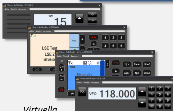
Virtuella kontrollhuvuden från olika radiotyper

Till många radiomodeller har SoftRadio ett virtuellt kontrollhuvud som liknar radios eget kontrollhuvud. Med det virtuella huvudet aktiverat kan man byta kanal/talgrupp, skicka meddelanden mm. Huvudet öppnas/stängs genom att man klickar på namnlisten.